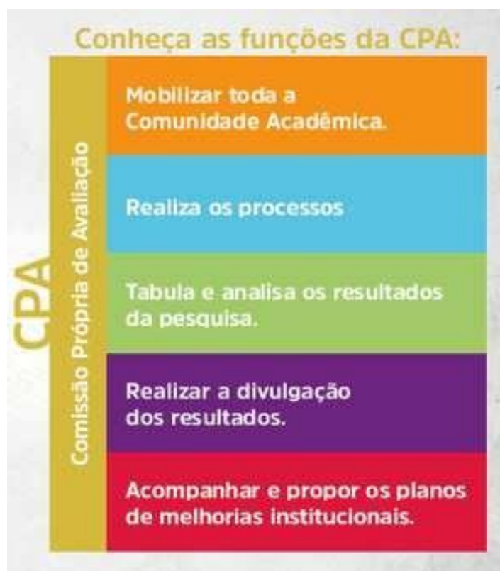
Quadro 4 – Funções CPA